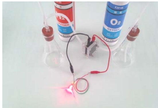
実験例：水素ガスと酸素ガスで発電しLED電球を点灯！